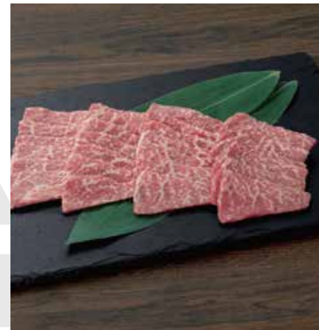
G03 赤城和牛 モモ焼肉 400g