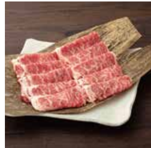
G04 赤城牛 肩ロースすき焼き 400g