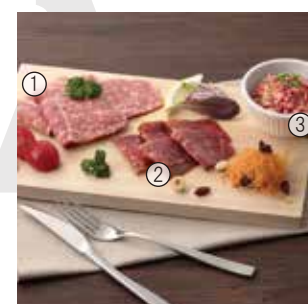
G12 鳥山牧場産 赤城和牛 贅沢おつまみセット

①リンダーザフトシンケン(ハム)…70g ②プレザオラ(生ハム)…50g ③コンビーフ…100g