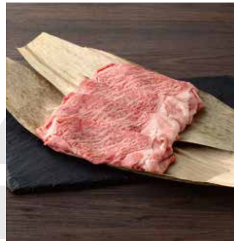
G02 赤城和牛 リブローズすき焼き 400g