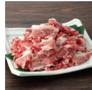
G10 赤城牛 切り落としメガ盛り 1kg (200g×5パック)