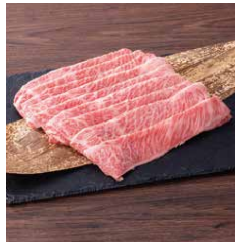
G01 赤城和牛 肩ロースすき焼き 400g