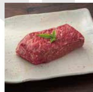
G08 赤城牛 モモブロック 300g