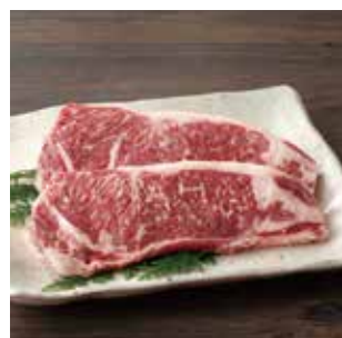
G06 赤城牛 サーロインステーキ 200g×2