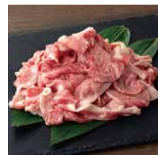
G11 赤城和牛 切り落としメガ盛り 1kg (200g×5パック)