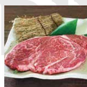
G09 赤城牛 シンタマ1ポンドステーキ 450g