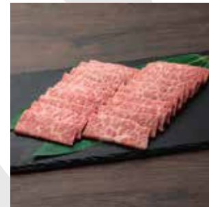
G07 赤城和牛 上カルビ焼肉 400g