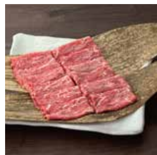
G05 赤城牛 モモすき焼き 400g